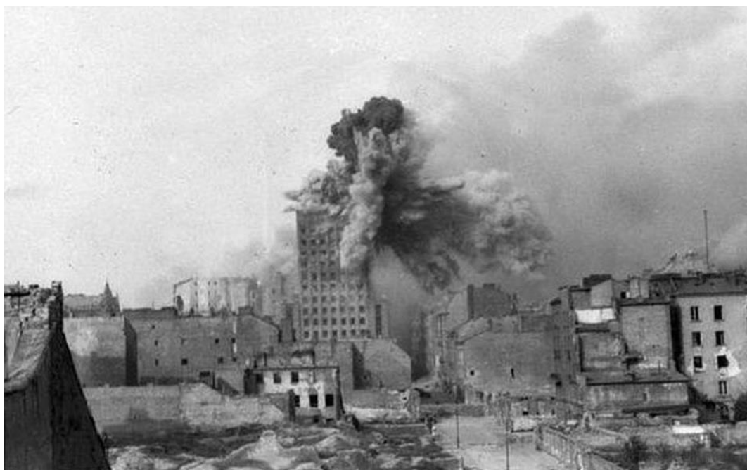
Fot. 6. Powstanie Warszawskie, wybuch pocisku na gmachu Prudentialu