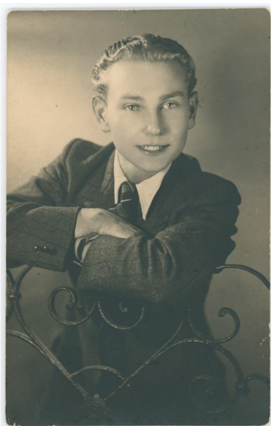
Fot. 1. Paweł Lukas / fot. autor nieznany / ze zbiorów MPW